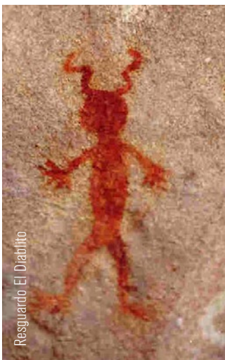
Resguardo El Diablito