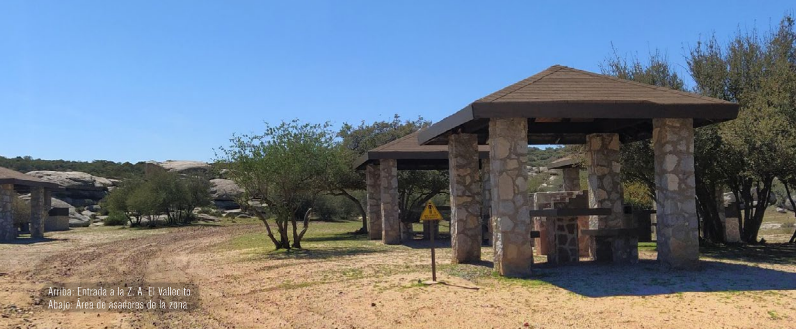
Arriba: Entrada a la Z. A. El Vallecito. Abajo: Área de asadores de la zona