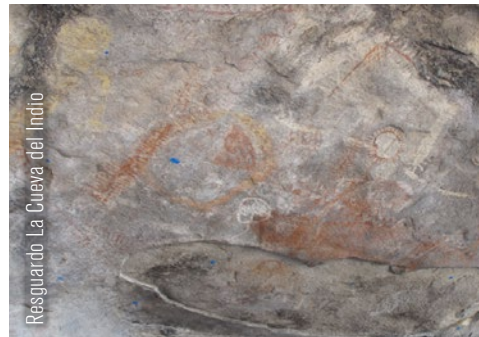
Resguardo La Cueva del Indio