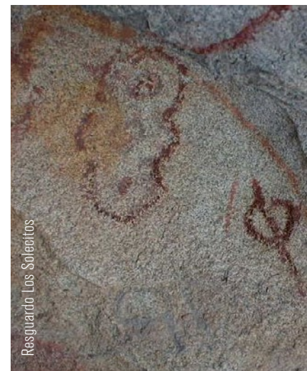
Resguardo Los Solecitos