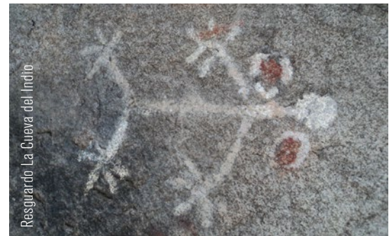
Resguardo La Cueva del Indio