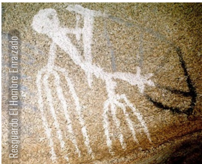
Resguardo El Hombre Enraizado

El recorrido por los cinco resguardos rocosos para admirar pinturas rupestres te brindará una experiencia única, más que interesante, maravillosa. El trayecto, que puede durar hasta dos horas, se realiza a través de un sendero temático de dos kilómetros y pasa por los conjuntos de resguardo denominados: Tiburón, El Diablito, El Hombre Enraizado, La Cueva del Indio y Los Solecitos.