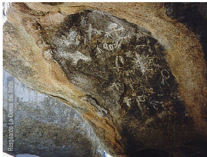
Resguardo La Cueva del Indio